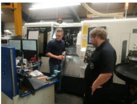
Optimering hos Lund Maskinfabrik

Foruden de interne studier hos DAMRC, er der i projekt forløbet også gennemført mere end 10 industricases på fræsning og drejning. Her har den typiske produktivetsforøgelse været +30% - i flere tilfælde +50%. Resultatet heraf har været energireduktioner per emne/proces mellem 3- og 12%.